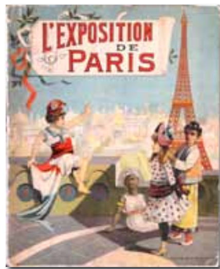
L'Exposition de Paris. Imp. Van Meer.

Affiche promotionnelle pour l'attraction «Tour de Nesle », installée en marge de la zone de l'Exposition, près de la Motte-Picquet. Aux côtés de la tour, reconstituée à taille réelle (26 mètres), comédiens et danseurs rejouaient son histoire.