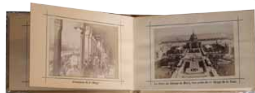
Album de la Tour Eiffel. Neurdein Frères