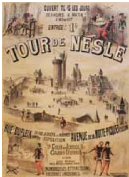
J. JONCHEZ. Tour de Nesle. Imp. Floucaud. 92 x 124 cm

L'Exposition de 1889 est l'occasion pour la République de célébrer les cent ans de la Révolution Française, ce qui suscite les réticences de certaines monarchies. Inaugurée par Sadi Carnot le 6 mai, l'Exposition accueille 360.000 exposants de 50 pays sur 95 hectares et s'étend jusqu'aux Invalides. Le Champ-de-Mars abrite le Palais des Machines, des Beaux-Arts et des Arts Libéraux ainsi que 81 autres édifices, sans compter la reine de la manifestation, la Tour de 300 mètres dont l'édification aura duré vingt-sept mois.